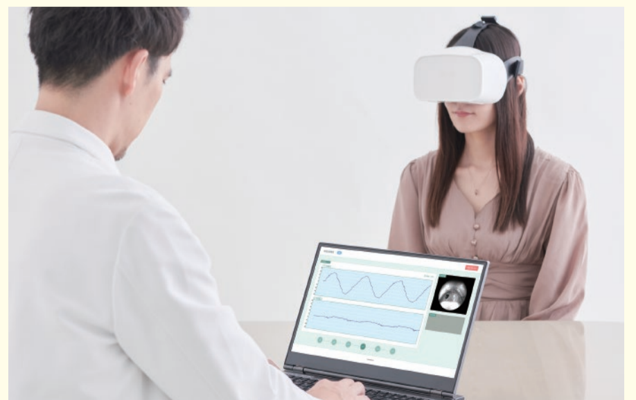
検査中のイメージ